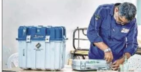
EVMS being sealed after an election

■ Booths will be set up near their current homes