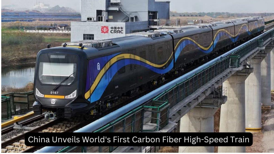
China Unveils World's First Carbon Fiber High-Speed Train