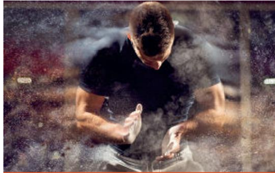
Convention on the Manipulation of Sports Competitions (the Macolin Convention)